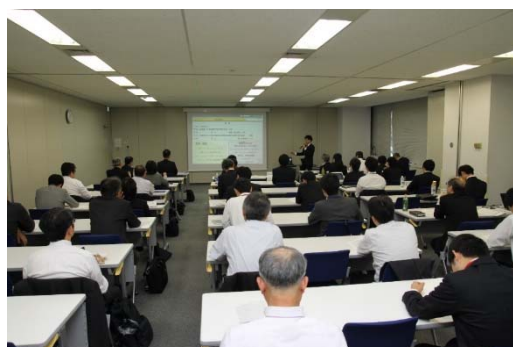
研究発表会 & 博士活躍事例紹介(2017年10月)